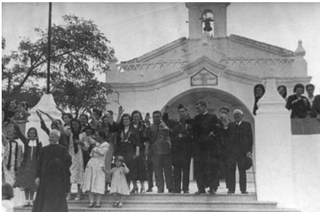
Celebración de la Guerra Civil en la ermita de la Soledad, 1939

No pretendo que este sea un discurso lacrimoso o revanchista en cualquiera de sus posibles facetas, nada más lejos de mi intención. En una guerra pierden todos excepto los que la organizan. Esto me quedó claro cuando entrevistando a un señor que fue enrolado en el Ejército Sublevado me dijo “yo no fui a la guerra, a mí me llevaron...” Estas palabras son muy ilustrativas de los sentimientos y las emociones que se escondían en estos hombres que de un lado o de otro se vieron inmersos, unas veces por obligación y otras por convicción, en una guerra que les obligó a luchar con sus hermanos y vecinos pero no codo con codo sino frente a frente.